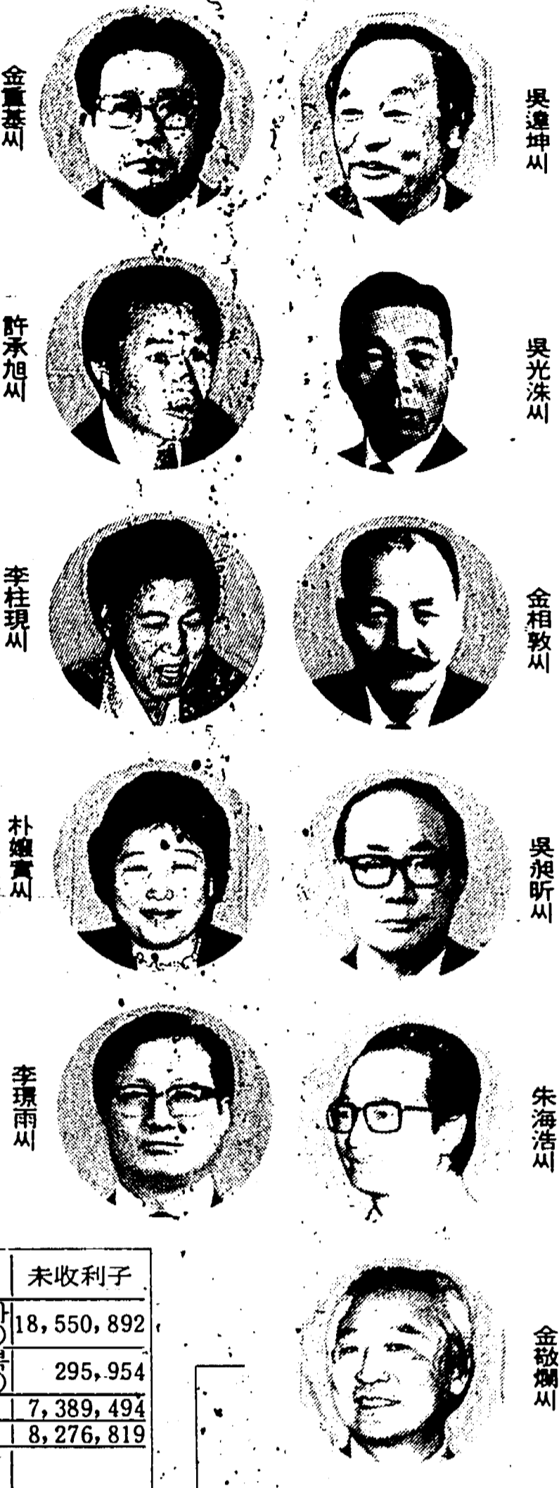
東亞꿈나무 寄託者의 얼굴

「東亞꿈나무財團」의 발족은 10년 전 1975년 4월 1일 「東亞」가 창간 10주년을 맞아 「萬여명 격려廣告」를 게재한 후 그 수익금 7억 원이 「東亞꿈나무財團」에 기탁된 것을 계기로 이루어졌다. 이 7억 원은 「東亞」가 창간 10주년을 맞아 「萬여명 격려廣告」를 게재한 후 그 수익금 7억 원이 「東亞꿈나무財團」에 기탁된 것을 계기로 이루어졌다.